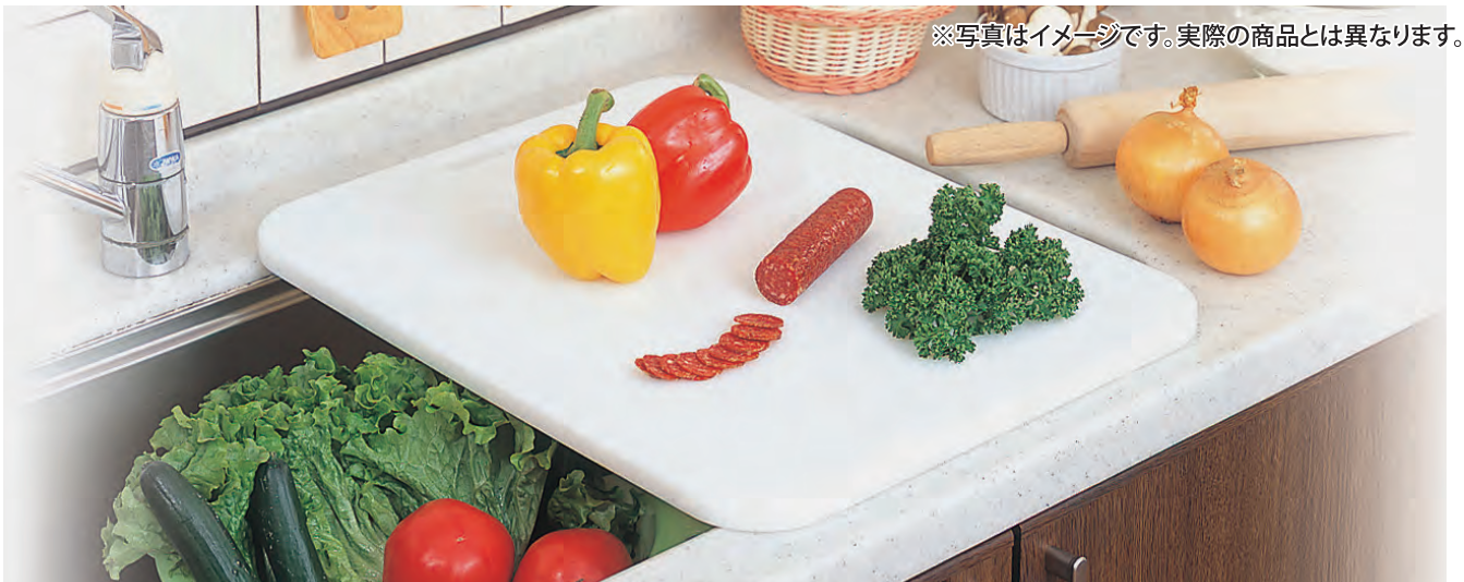
※写真はイメージです。実際の商品とは異なります。

調理面積が広いので、シンクに“渡しがけ”できる!! 耐熱素材を使用したワイドサイズの抗菌まな板です。